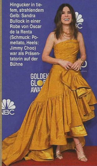
Hingucker in tiefem, strahlendem Gelb: Sandra Bullock in einer Robe von Oscar de la Renta (Schmuck: Pomellato, Heels: Jimmy Choo) war als Präsentatorin auf der Bühne