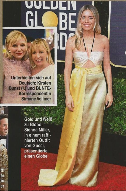
Gold und Weiß zu Blond: Sienna Miller, in einem raffinierten Outfit von Gucci, präsentierte einen Globe